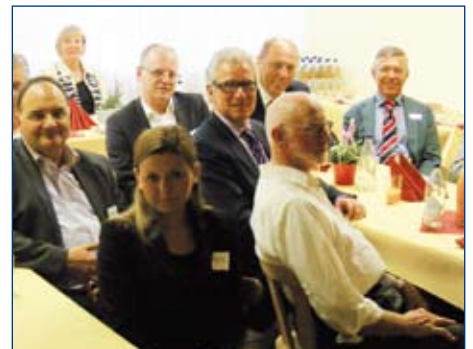
Angenehmes Ambiente bei Nickert (Club-Mitglieder)