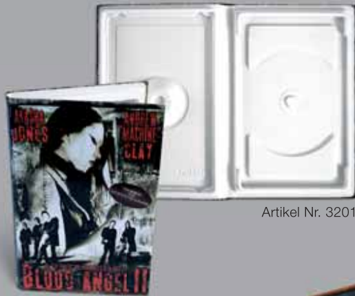
Artikel Nr. 3201