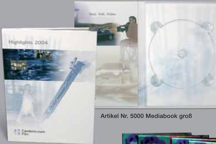
Artikel Nr. 5000 Mediabook groß