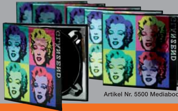
Artikel Nr. 5500 Mediabook klein