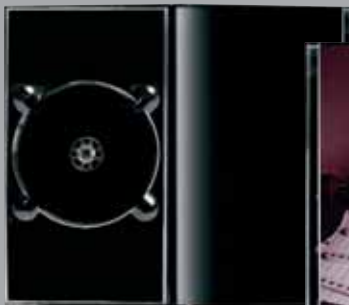
Artikel Nr. 5315 Mediabook Booksize

Mediabook Booksize mit Longtray: 145 x 253 mm