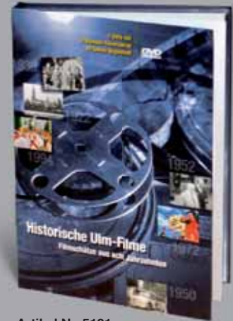
Artikel Nr. 5101 Mediabook groß

Im NICKERT MEDIABOOK® finden auch Doppel-Alben oder Best-of-Collections Platz!