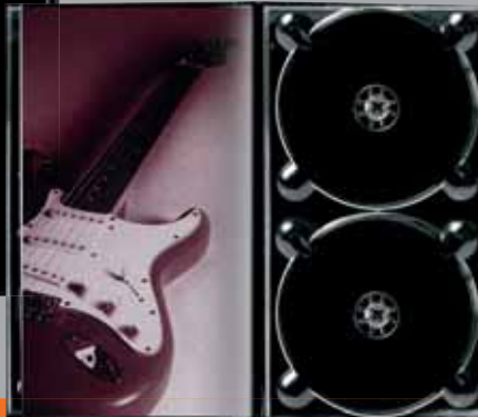
Artikel Nr. 5313 Mediabook Booksize

MEDIABOOK® Booksize mit Longtray – beeindruckend präsentieren!